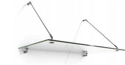
SZKLANE ZADASZENIE NAD WEJŚCIEM_Z-1 235x120